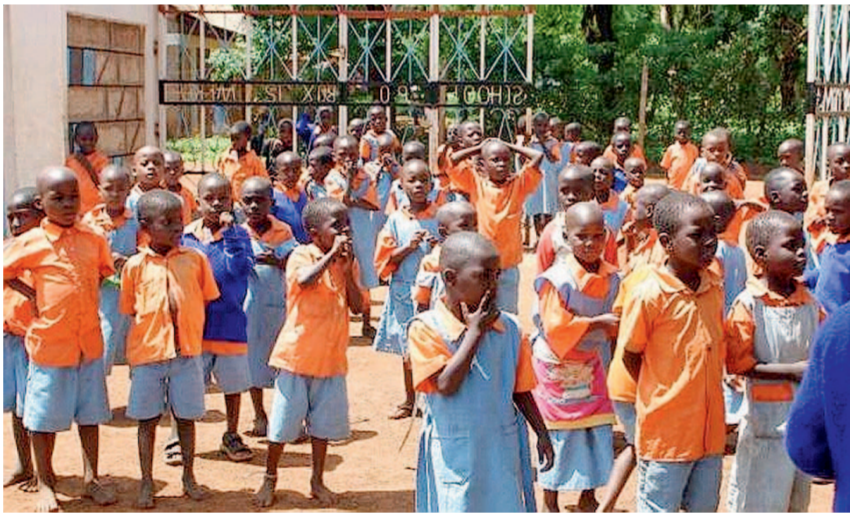
DEMOCRAZIA DIGITALE In alto, volontari di «Isf» Puglia aprtono l'internet point in Abruzzo. Accanto, bambini in Kenya in una scuola informatizzata dal gruppo

A Bari si è appena tenuta l'assemblea nazionale di «Isf» al Dipartimento di Informatica dell'Università, in seno al quale si è formata la costola pugliese dell'associazione, attivissima nello sviluppo di vari software e nella