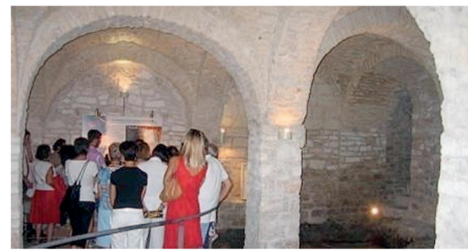
LA CITTÀ NASCOSTA Rispinte 2mila domande di persone che restano in lista d'attesa