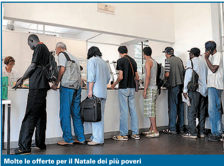
Molte le offerte per il Natale dei più poveri

La mensa festiva dei Gruppi di Volontariato Vincenziano, in via Saccarelli 2, è aperta il giorno di Natale a pranzo, come in ogni altra festività e domenica, ma con un pranzo più "gustoso", e accoglie oltre cento persone. Il giorno 26 distribuisce sacchetti pasto. Info 011.480433. I Servizi Vincenziani per i senza fissa dimora, in via Nizza 24, offrono una cena ai "loro poveri", cioè alle persone seguite anche durante l'anno, il 24 sera dopo la Santa Messa delle